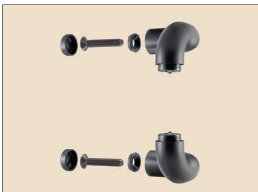
art. 352/S supporti per un maniglione da fissare con viti passanti