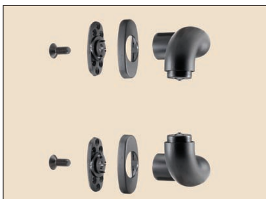
art. 353/S supporti per un maniglione da fissare con rosette