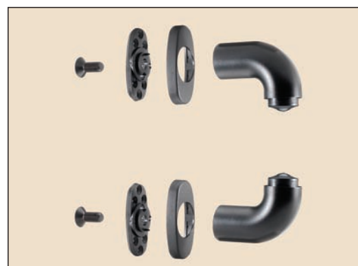
art. 357/S supporti per un maniglione da fissare con rosette