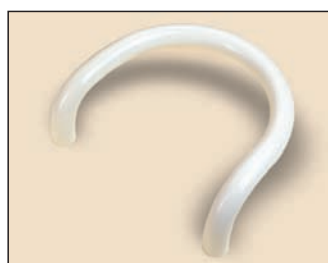
art. 370 Ø 30 L. 260

A richiesta tutti i colori della gamma RAL