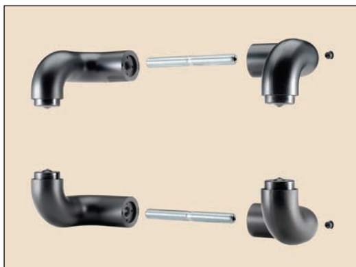
art. 351/S supporti per due maniglioni da fissare contrapposti (interno ed esterno della porta)