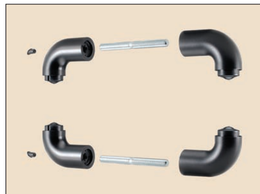
art. 355/S supporti per due maniglioni da fissare contrapposti (interno ed esterno della porta)