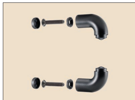
art. 356/S supporti per un maniglione da fissare con viti passanti