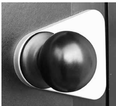
montaggio con utilizzo dei fori 'B'