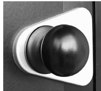
montaggio con utilizzo dei fori 'C'

In caso di fissaggio contrapposto (esterno-interno dell'infisso) è possibile utilizzare le viti passanti in dotazione inserendole in due fori dell'Isola a piacimento e abbinandole alle viti autofilettanti per ottenere un bloccaggio perfetto.